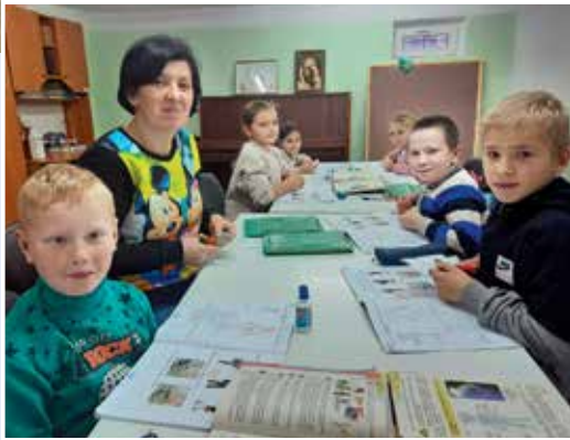
Hier lernen wir.